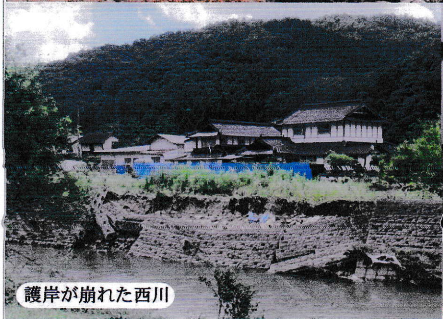
護岸が崩れた西川