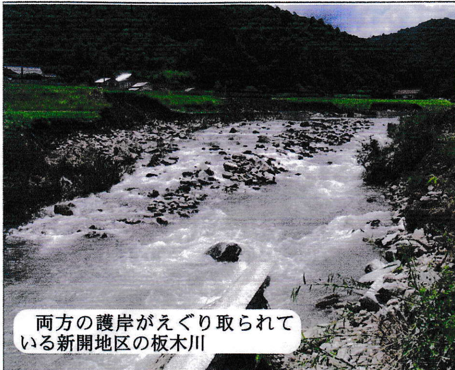
両方の護岸がえぐり取られている新開地区の板木川