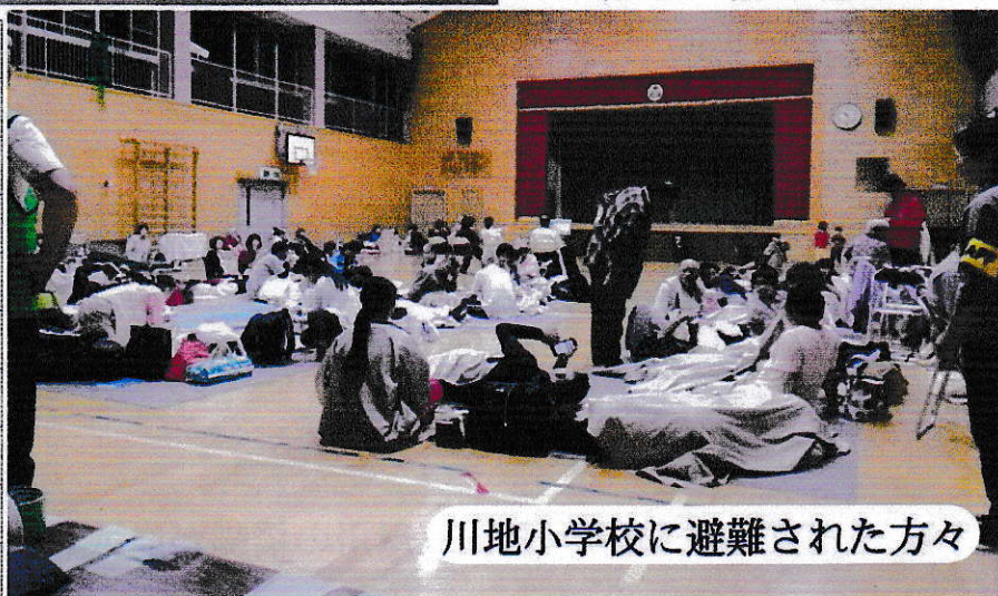
川地小学校に避難された方々