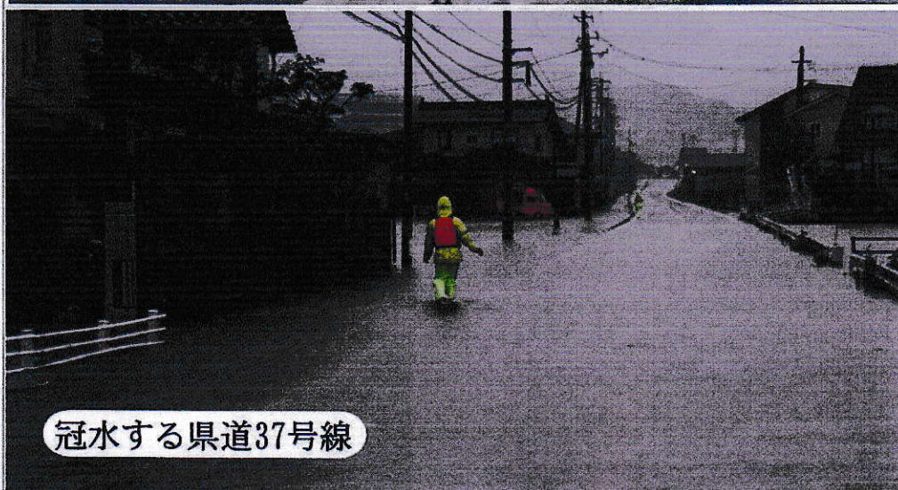
冠水する県道37号線

7月6日、西日本を襲った未曾有の豪雨災害は、三次市にも昭和47年の水害に匹敵する量の雨を降らせ、川地地区でも、9か所にのべ360人が避難しました。人的災害がなかったのが、不幸中の幸いでしたが、土砂崩れや、家屋・田畑の浸水、堤・井手・護岸・橋梁の損壊など大きな爪痕を残しました。災害復旧について関係各所に要望し、迅速な対応をしていただいております。