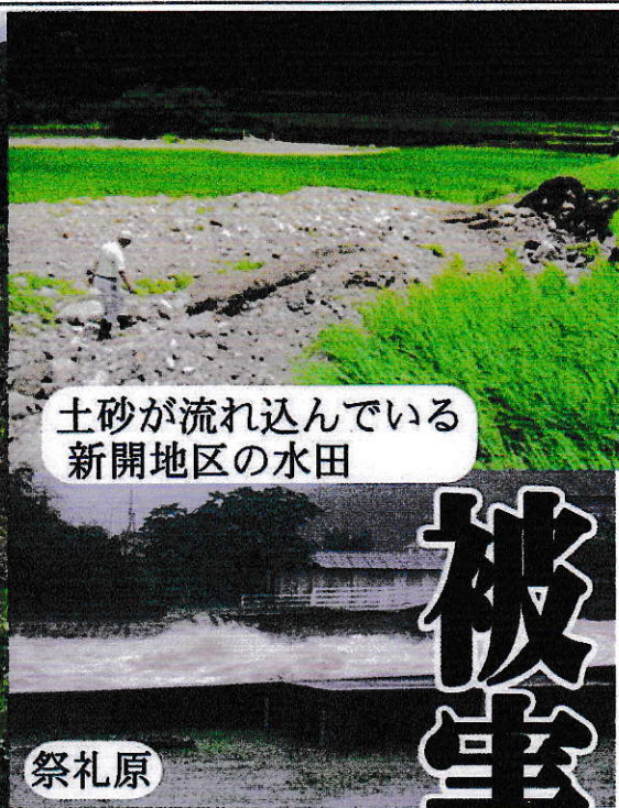
土砂が流れ込んでいる新開地区の水田